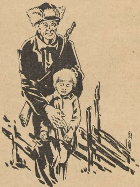
Ärni, jah Ärni. . . (Vt. lhk. 85.)